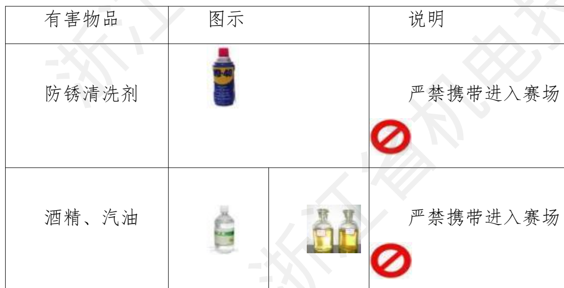
表 4 选手禁带的物品

选手禁止携带易燃易爆、腐蚀性、有毒有害物品，本表为禁带物品示例，所有国家规定的易燃易爆、腐蚀性、有毒有害物品均严禁携带，具体见下表所示。